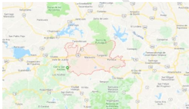
Ubicación de Maravatío Michoacán

UBICACIÓN: Se localiza al noreste del Estado, en las coordenadas 19°54' de latitud norte y 100°27' de longitud oeste, a una altura de 2,020 metros sobre el nivel del mar. Limita al norte con el Estado de Guanajuato y Epitacio Huerta, al este con Contepec y Tlalpujahua, al sur con Senguio, Irimbo e Hidalgo, y al oeste con Zinapécuaro. Su distancia a la capital del Estado es de 91 kms.